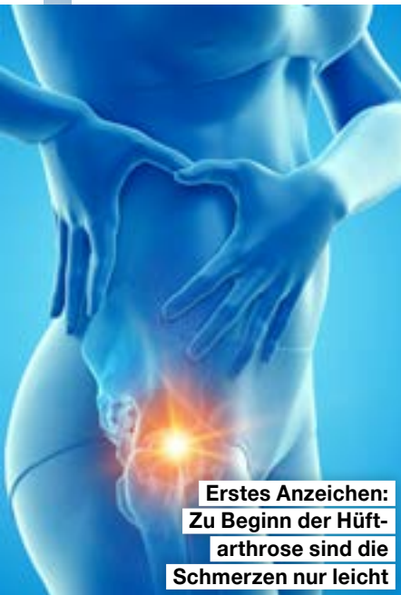
Erstes Anzeichen: Zu Beginn der Hüftarthrose sind die Schmerzen nur leicht

„Sitzen Sie möglichst nicht lange, bleiben Sie in Bewegung. Gehen Sie viel zu Fuß, tragen Sie besser gedämpftes Schuhwerk und vermeiden Sie schwere Lasten. Trainieren Sie stets auch Ihre Bein-, Bauch- und Oberkörpermuskulatur.“